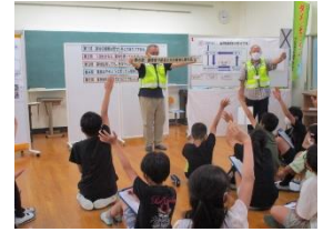
↑ 小学校での 薬物乱用防止教室