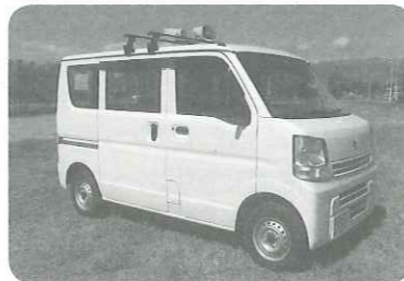
▲少年センター広報車