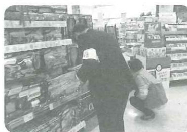
▲有害図書等立入調査