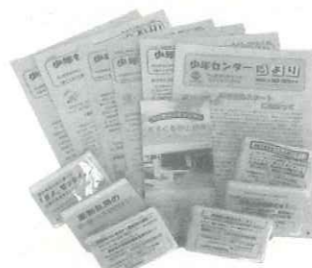
▲「少年センターだより」を年6回発行