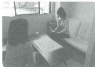
▲カウンセラーによる相談