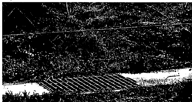
(記) 中村 一雄

また、あたらしいところでは、平成7年(1995)1月15日号の「広報もりやま」に紹介されている温泉がある。今浜町の湖岸、かつてのみさき公園の跡地から掘削工事によって温泉がわき出たことが報じられている。それによると温泉は地下約1100mのところからでて、地表で40.4度、泉質は弱アルカリ性で、湯量は最大毎分527リットルと記されている。