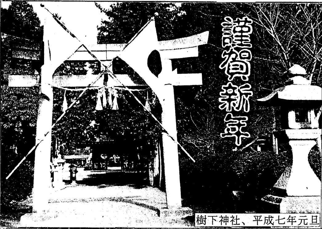
樹下神社、平成七年元旦

信 通 保 水 第 3 号 (新 春 号) 編 集 ・ 発 行 水 保 営 農 ビ ジ ョ ン 広 報 部 平 成 7 年 1 月 1 日 発 行