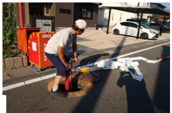
スピンドルで開栓、水を 放出