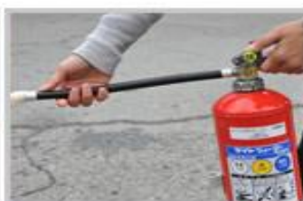
3 ノズルを火元に向ける