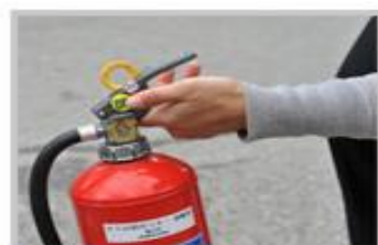
1 レバーの下側だけを 片手で持つ