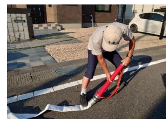
筒先をホースにつなぐ