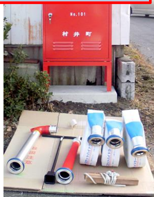
消火栓ボックスの器具類