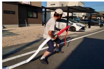
筒先をしっかり持つ て放水