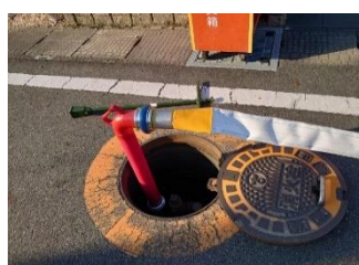
消火栓にスタンドパイプを 装填、ホースをつなぐ