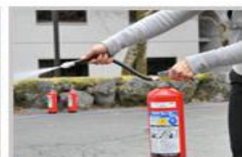
4 レバーを握って、 消火剤を放射