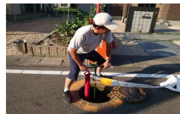
スピンドルで閉栓